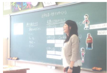
【2年生学級：ソーシャルスキルトレーニング】