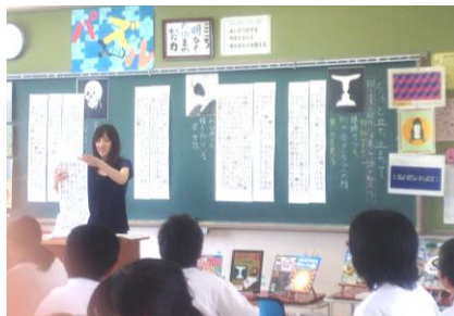
【1年生国語：説明文の読解】