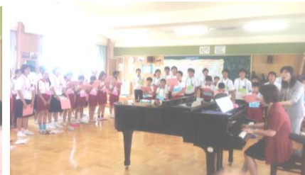
【3年生音楽：共に“地球星歌”を歌おう】