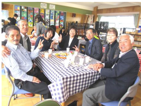
【「喫茶どうたくん」で歓談するご来賓の皆さま】

文化祭については前号に掲載しましたが、PTA役員や文化部の皆さまには「喫茶どうたくん」でご協力いただき、ありがとうございました。また、多くのご来賓や保護者の皆さまがお越しくださり、子どもたちにとってかわわりを学ぶ場や、励みとなりましたことに心から感謝いたします。