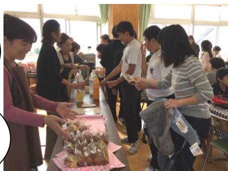
【「喫茶どうたくん」を切り盛りするPTAの皆さま】

そして、前芝中学校には教職員から子どもたちへ、先輩から後輩へと、支えや思いやりのつながりがあることを実感し、温かい気持ちになる日々です。少しご紹介をします。