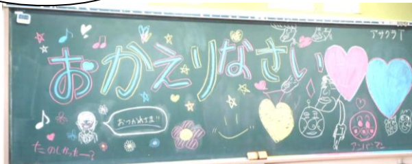
【福祉体験から帰ってきた1年生に2年生からのメッセージ】