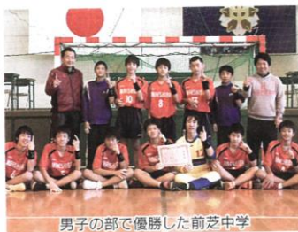
男子の部で優勝した前芝中学

東三河中学新人ハンドボール 表の前芝が首位を獲得。女子トーナメントは石巻と蒲郡中部の地区 1 位が順当に決勝に進み、前半で 2 点リードした蒲郡中部が後半も攻勢を強めて逃げ切った。 【男子】▽決勝リーグ 前芝 18-12 大塚、前芝 27-14 豊橋南部、大塚 20-15 形原、大塚 16-4 豊橋南部、形原 23